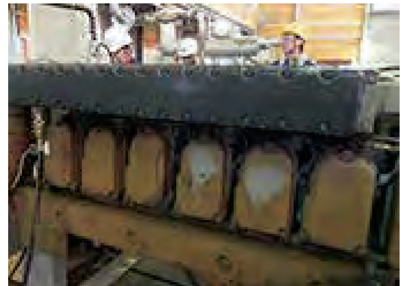
気動車エンジンに塗布

■株式会社 M. I. Tリンクご案内 より詳しい情報をアップしています。右記QRコードよりアクセスして是非一度ご確認下さい!!