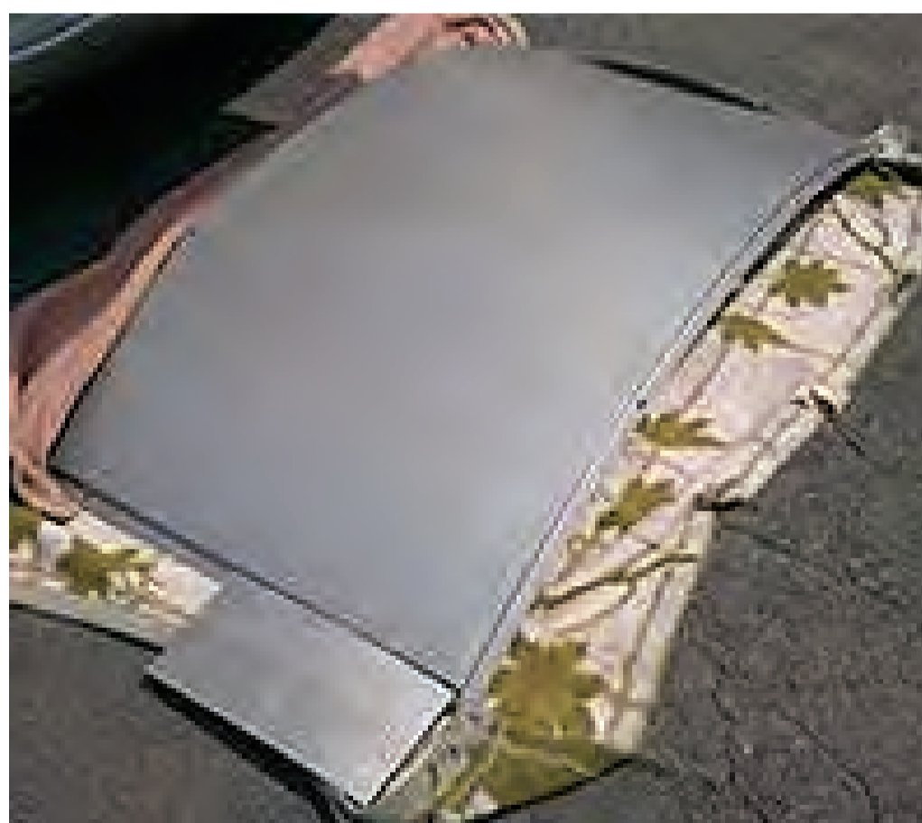
瑞風天井カバーへ塗布