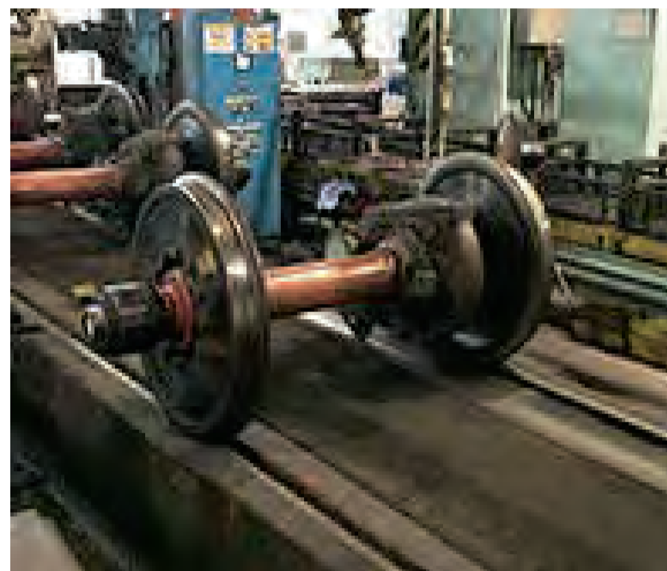
輪軸のジンキ塗料剥離