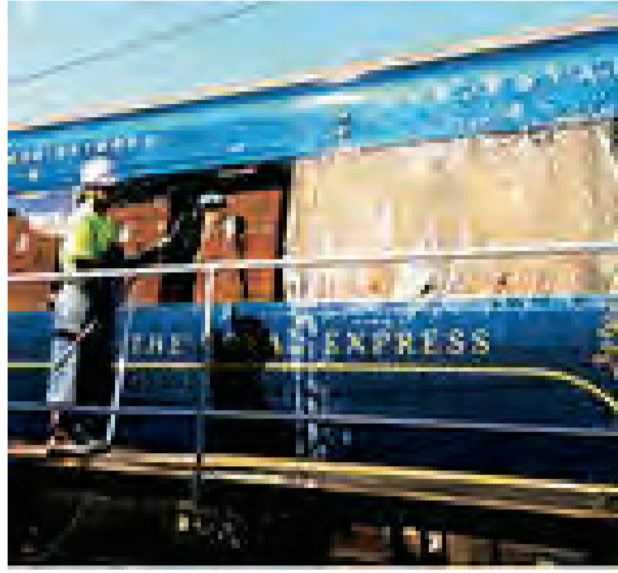
ECO アルカリクリーナー洗浄