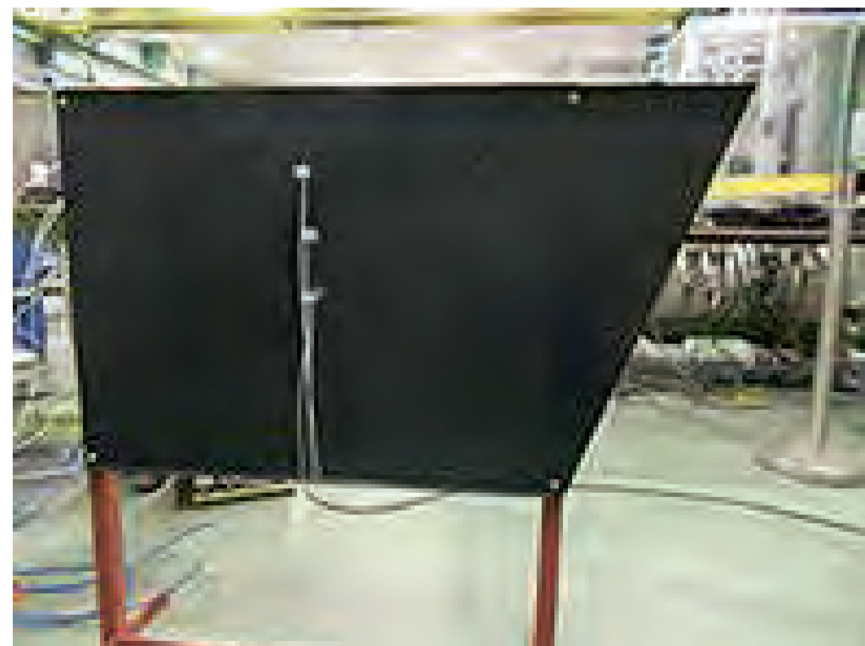
北陸新幹線ふさぎ板へ塗布