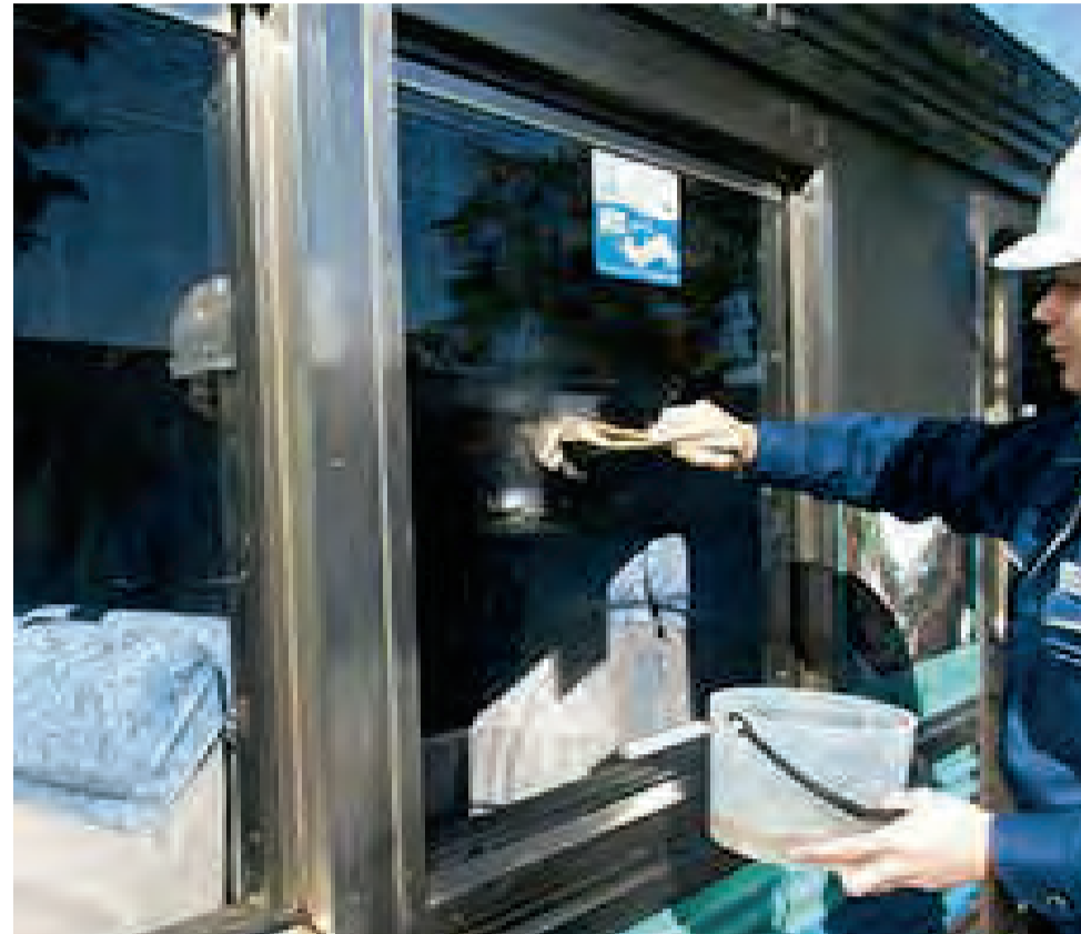
グローバル-1による洗浄