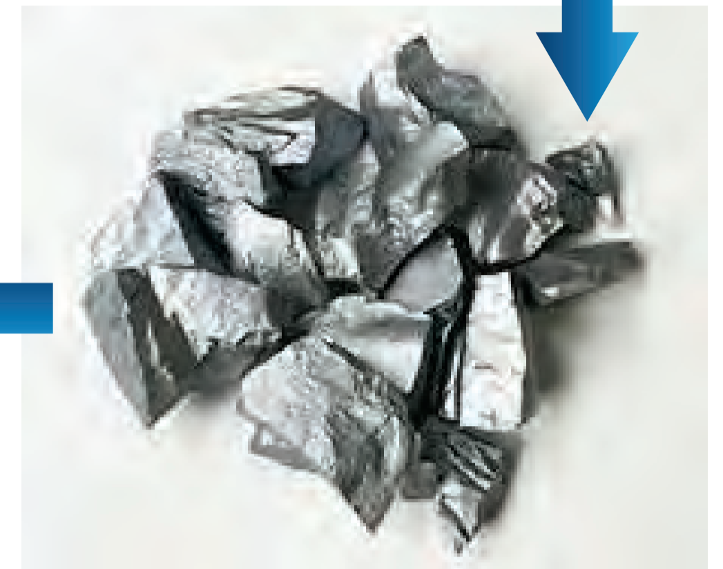
ポリシリコン人工鉱石ナゲット