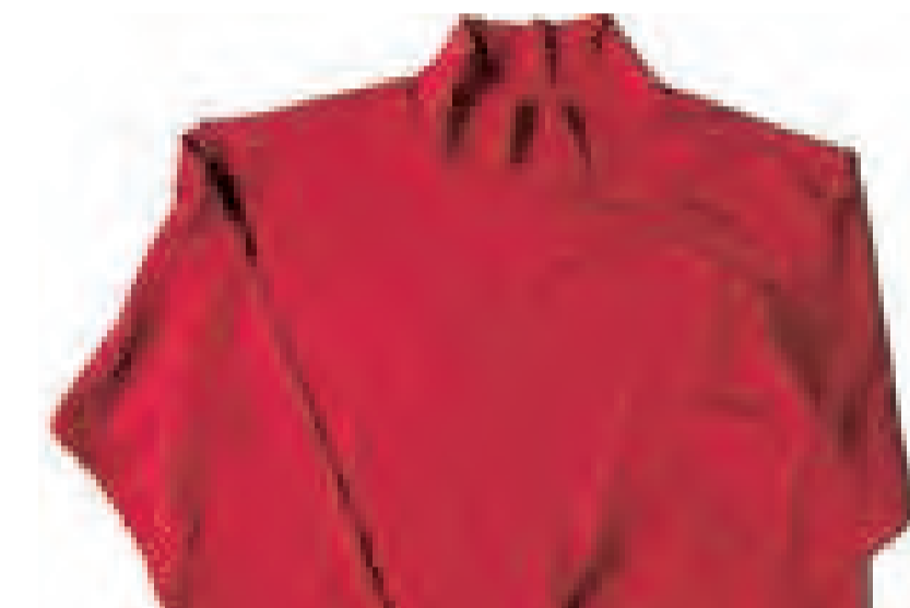
パウダーをプリント