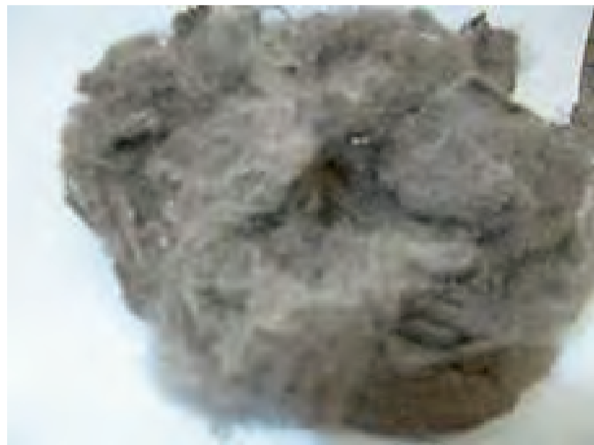
ポリシリコンわた