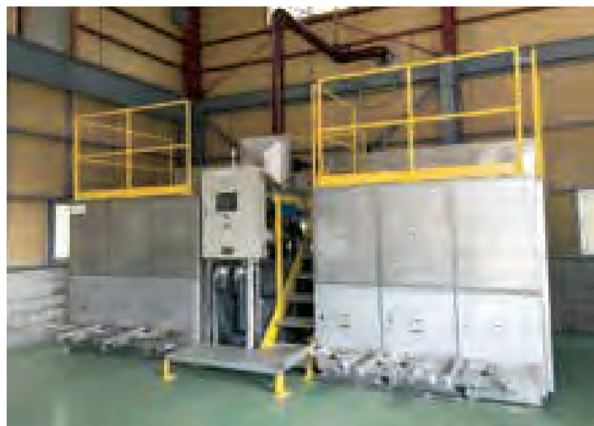
モミ殻シリカ生成機エシカルスター