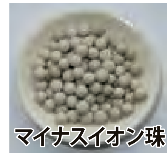
マイナスイオン珠