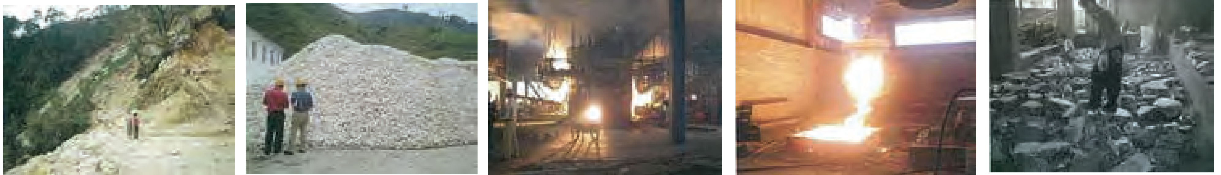
ポリシリコン人工鉱石製造のながれ