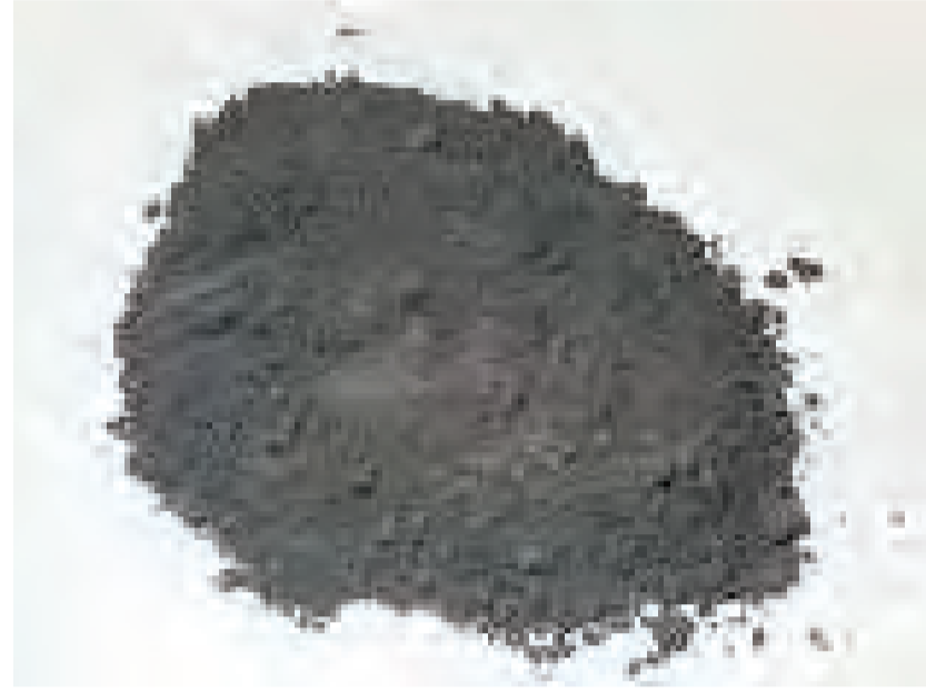
ポリシリコンパウダー